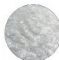
Glitter Pérola Azul