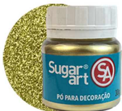
Pó Dourado Verdadeiro

Os seus Pós e Glitters favoritos agora em potes de 20g e 30g