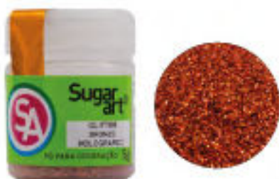
Glitter Bronze Holográfico