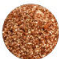
Glitter Nude Rose