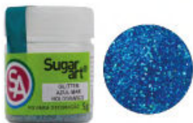
Glitter Azul Mar Holográfico