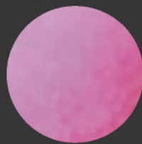
Rosa Pink Neon