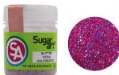
Glitter Rosa Holográfico