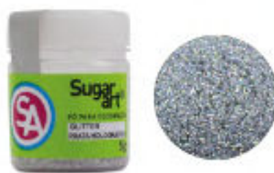
Glitter Prata Holográfico